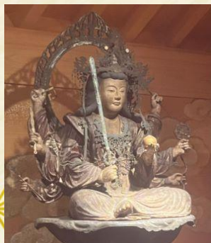
←八臂弁財天 妙音弁財天→

初めての人はもちろん、リピーターの人も新しい発見を！ 新春の七福神巡りで、古を偲び新たな出会いと幸運を祈りましょう！ 最後に、弁天様が祝ってくれます